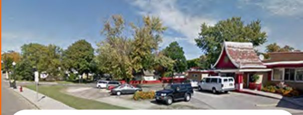
Lao Cultural Center Building ອາຄານຂອງສູນວັທນະທັມລາວ (LCC) 2648 W Broadway Ave. Minneapolis, MN 55411